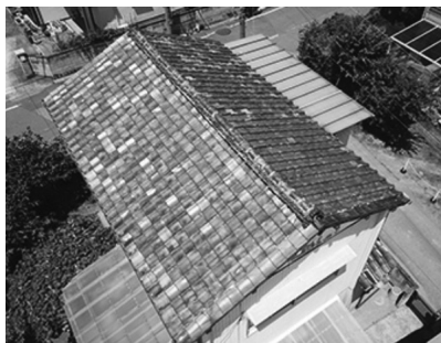
家を斜め上から撮影した映像

くりされます。また、ドローンを飛ばしていると、それに気づいた近所の方々も集まってくる、ちょっとしたコミュニケーションが生まれます。